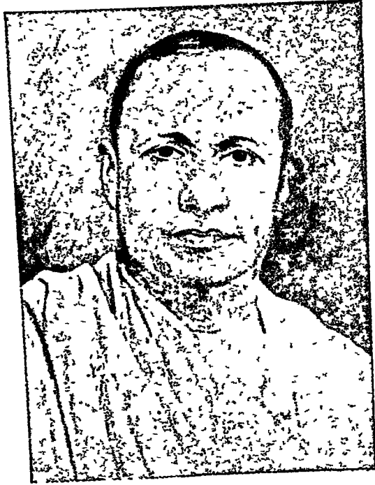
श्री जयशंकर प्रसाद